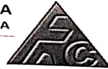
Grafica primer semestre 2020

¡Nuestra Prioridad es tu Salud y Seguridad!